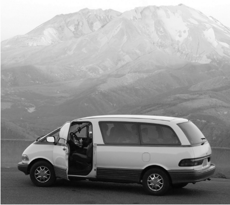
1. Un monovolumen , ideal para familias con niños