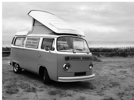
6. Una furgoneta , para moverse con total libertad.