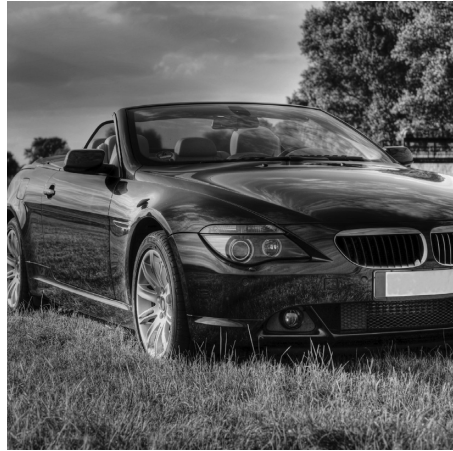
2. Un deportivo , para sentir el placer de conducir.