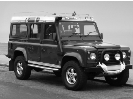
3. Un todoterreno , lo mejor para disfrutar del campo y la montaña.