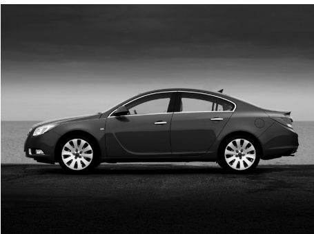
5. Un coche muy pequeño , clásico y elegante.