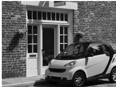
4. Un coche muy pequeño , la mejor opción para moverse por la ciudad.